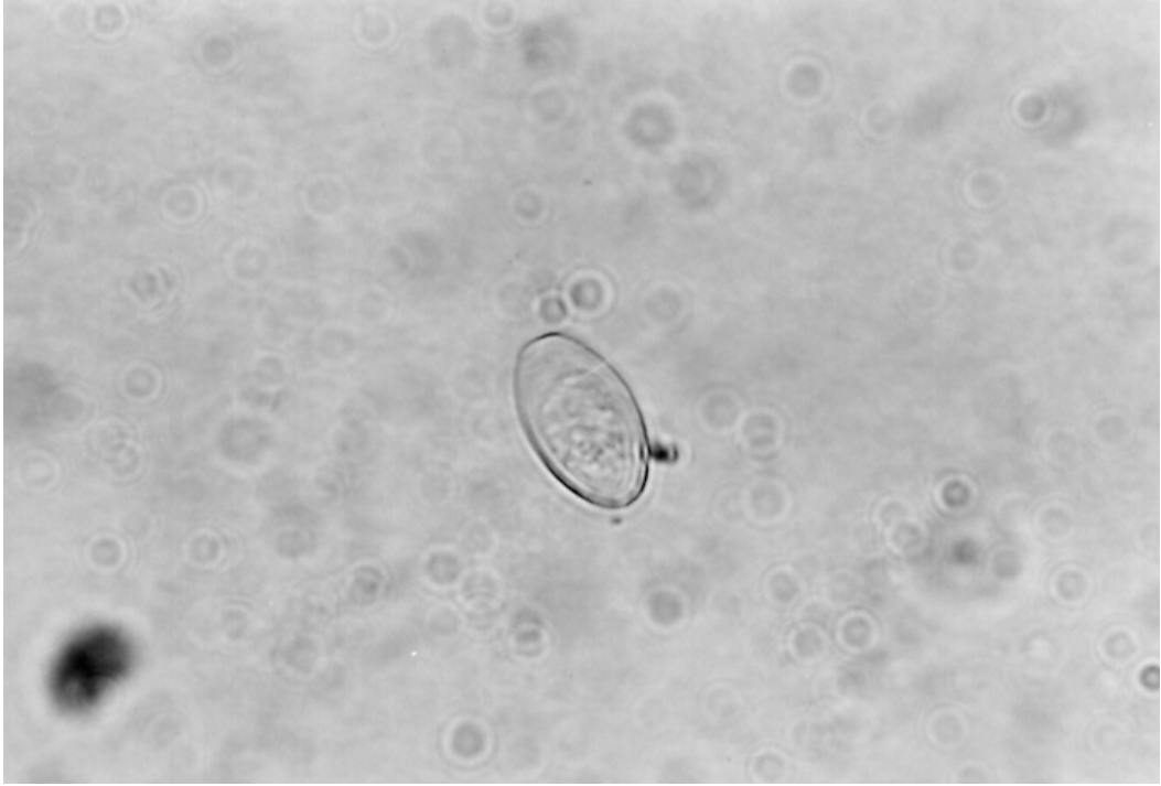
Şekil 4. Peziza arvernensis 'in askosporu (10x100).