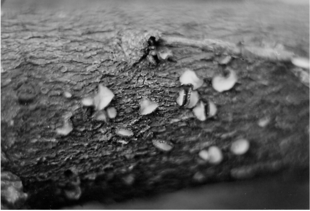
Şekil 1. Lachnellula arida 'nın askokarpları.