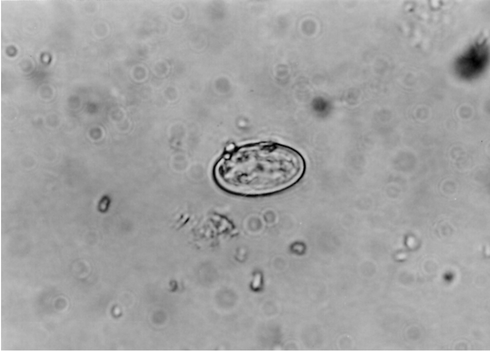
Şekil 8. Peziza domiciliana 'nın askosporu (10x100).