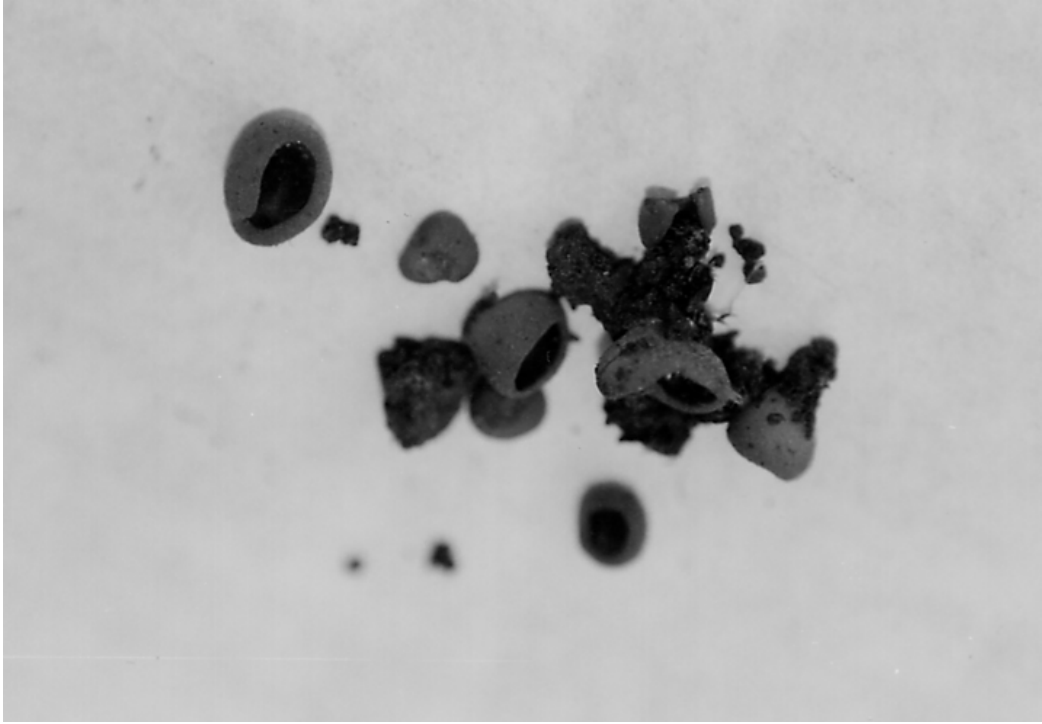
Şekil 5. Peziza celtica 'nın askokarpları.