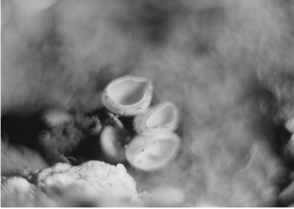
Şekil 7. Peziza domiciliana 'nın askokarları.