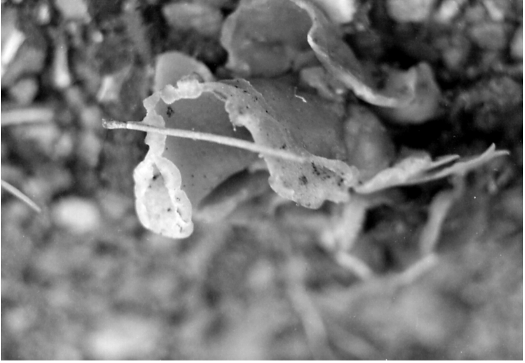
Şekil 3. Peziza arvernensis 'in askokarları.